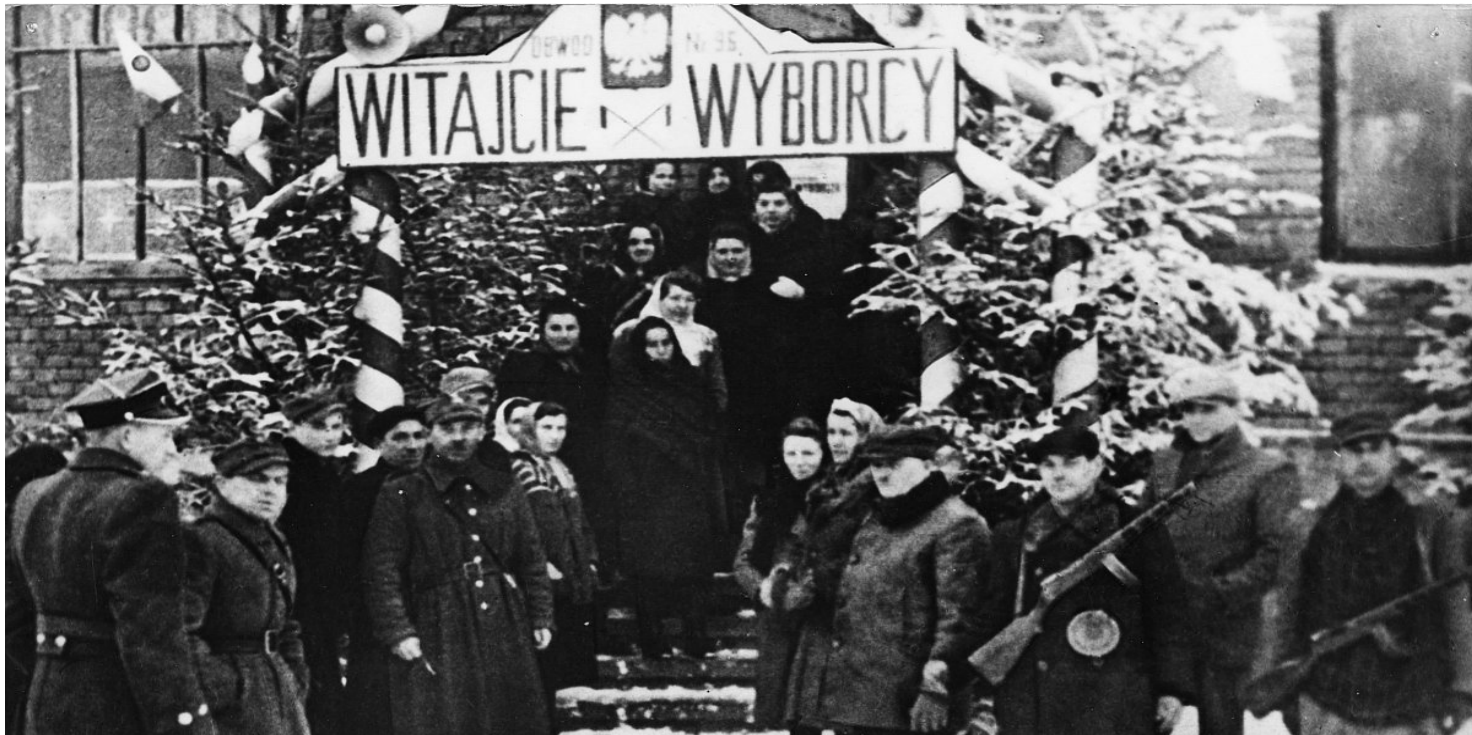
Wejście do lokalu wyborczego w Sanoku, 19 I 1947 r.

https://przystanekhistoria.pl/pa2/tematy/ruch-ludowy/39301,Polacy-glosuja-PPR-decyduje.html