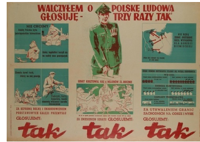
Przedreferendalna ulotka propagandowa

Plakat propagandowy z roku 1946 - referendum 3 x TAK. Za czytającym, żołnierz NSZ, przedstawiony jako kolaborant hitlerowski, namawiający do głosowania na NIE