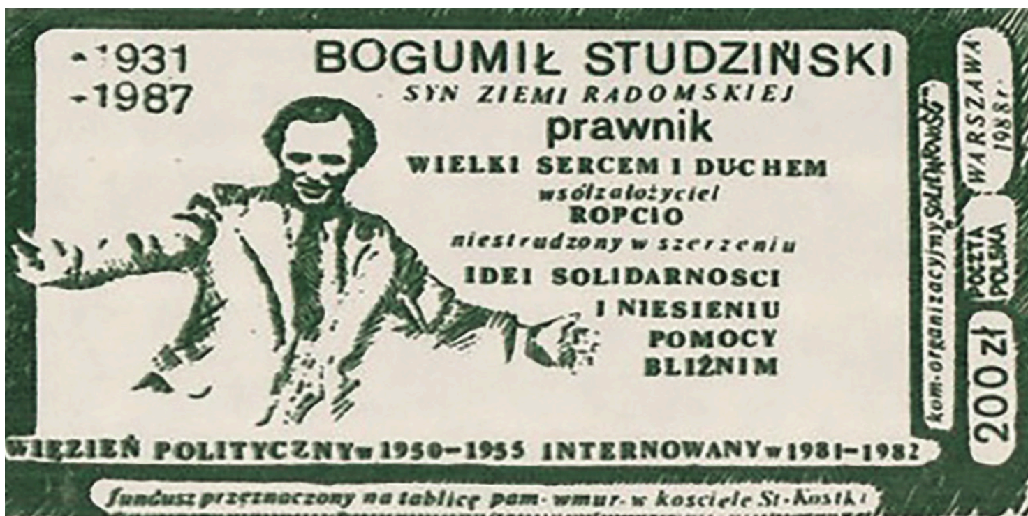
Cegielka kolportowana przez Solidarność w 1988 r.

https://przystanekhistoria.pl/pa2/tematy/ropcio/98238,Wspoltworca-ROPCiO-Bogumil-Studzinski-19311987.html