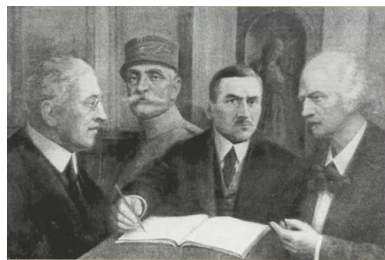
Prezydent Woodrow Wilson, marszałek Ferdinand Foch, Roman Dmowski i Ignacy Paderewski, obraz olejny Kazimierza Szyta Podpisanie układu wersalskiego, 1923 r.