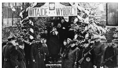
Wejście do lokalu wyborczego w Sanoku, 19 stycznia 1947 r.

„Inżynieria strachu” z lat 1944–1948, sfałszowanie referendum z 1946 r. i wyborów z 1947 r., dokonane przy biernej postawie zachodnich sprzymierzeńców Polski, doprowadziły do załamania postaw oporu. W latach 1948–1955/1956 społeczeństwo przygnoił strach przed reżimem, który sprawiał, że nie tylko publicznie, ale nawet w prywatnych rozmowach nie krytykowano władz. Doszło tym samym do przejścia od postaw oporu masowego – a więc m.in. charakteryzującego się zdolnością do zbiorowych wystąpień przeciw reżimowi, np. manifestacji, strajków robotniczych, protestów wobec kolektywizacji rolnictwa – do postaw przystosowania i zaangażowania.