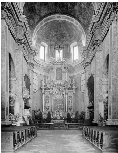
Wnętrze katedry pw. św. Jana Chrzciciela i św. Jana Ewangelisty w Lublinie w latach II wojny światowej.

Kiedy w lipcu 1949 r. w katedrze lubelskiej dostrzeżono „krwawą łzę” spływającą z wizerunku Matki Boskiej Częstochowskiej, wokół katedry zaczęły gromadzić się tłumy. Podobne wydarzenia identyfikowane jako cudy, gromadzące wiernych jednej lub kilku parafii, stanowiły reakcję na próby ateizacji społeczeństwa. Odpowiedzią władz stawały się akcje siłowego rozpędzania zgromadzeń i represje wobec wiernych, którzy w nich uczestniczyli.