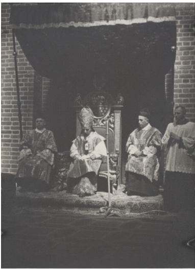
Prymas Stefan Wyszyński podczas uroczystości poświęcenia odbudowanej po II wojnie katedry św. Jana Chrzciciela we Wrocławiu, 29 lipca 1951 r.

Kolejnym etapem represji była likwidacja latem 1952 r. niższych seminariów duchownych. Nadal trwało rugowanie religii ze szkół oraz rozpoczęta w 1949 r. akcja tworzenia szkół ateistycznych.