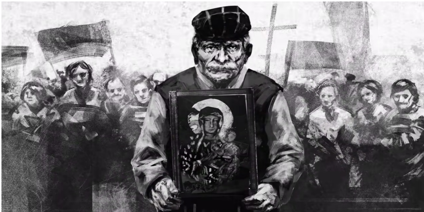
Kadr z animacji IPN Światło Wolności

https://przystanekhistoria.pl/pa2/tematy/represje/97879,Katolicy-w-komunizmie-Kosciol-polski-w-latach-1948-1956.html