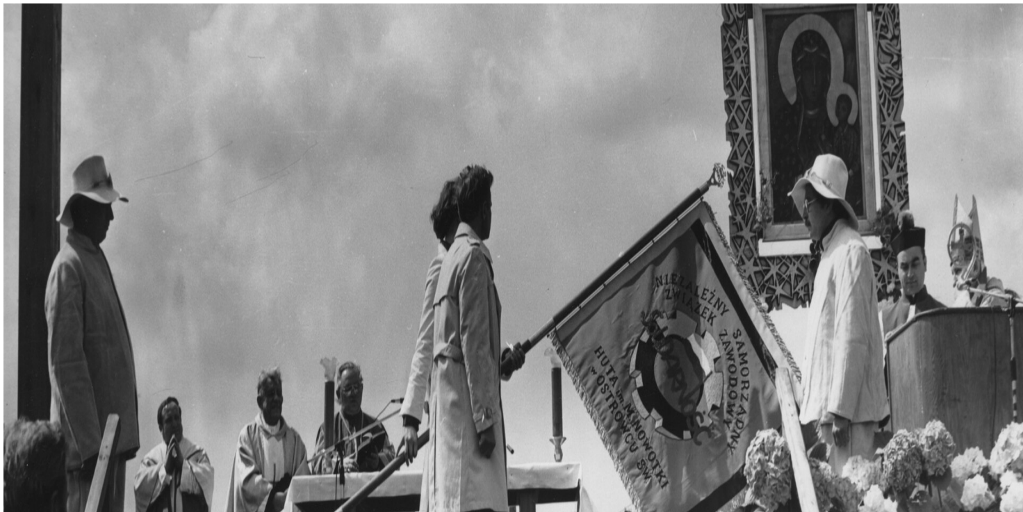
Fot. z zasobu IPN (dar prywatny Ludwika Kropielnickiego)

https://przystanekhistoria.pl/pa2/tematy/represje/97386,Spacer-po-cukierki-zakonczoney-w-osrodku-odosobnienia.html