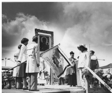
Poświęcenie sztandaru NSZZ „Solidarność” Huty im. Marcelego Nowotki w Ostrowcu Świętokrzyskim, 3 maja 1981 r.