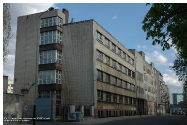
Zabudowania dawnej siedziby WUBP w Łodzi przy al. Karola Anstadta 7.

W aktach IPN zachowały się dwa protokoły z przesłuchań T. Wyrwy. Mówiąc o kolegach z partyzantki „Orlik” konsekwentnie podawał tylko ich pseudonimy. Co do własnego udziału w walce z Niemcami mówił, że swoją działalność rozpoczął w 1944 r. Nie udało się jednak ukryć związków z NSZ, które z punktu widzenia komunistycznych władz były najbardziej obciążające. W czasie przesłuchań pojawiał się też wątek PPR-owców zabitych przez oddział „Starego”. „Orlik” przyznawał, że na przełomie 1944/1945 r. rzeczywiście rozstrzelano 5 ludzi, podających się za członków PPR, którzy w okolicach Starachowic dokonywali bandyckich napadów.