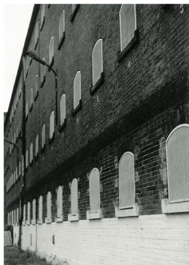
Więzienie przy ul. Kleczkowskiej 31 we Wrocławiu

W roku 1956 rozpracowanie obiektowe „Radwan” zostało rozbite na pojedyncze sprawy ewidencyjno-obszernicze. Bezpieka PRL nadal, w miejscach zamieszkania i pracy, inwigilowała oficerów i żołnierzy lwowskiej AK, jednak już w ramach indywidualnych rozpracowań.