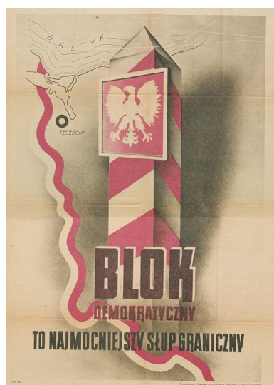
Plakat wyborczy tzw. Bloku Demokratycznego