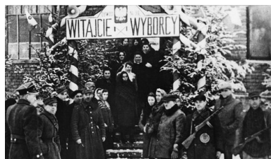
Wejście do lokalu wyborczego w Sanoku, 19 I 1947 r.

Według oficjalnych danych PPR i jej satelici uzyskali 80,1 proc. głosów przy zaledwie 10,3 proc. PSL-u. „Wybory to taka szkatułka: wchodzi Mikołajczyk – wychodzi Gomułka” – powtarzali ci, którzy nie mieli wątpliwości, co działo się 19 stycznia.