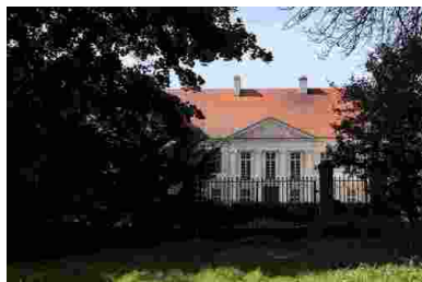
Pałac w Siedlcu współcześnie

Przymus pracy ( Arbeitszwang ) dotyczył także Polaków. Z samego Siedlca na roboty zabrano w czasie wojny około 30 osób. Przymus obejmował jednak nie tylko dorosłych, ale również dzieci powyżej 14 roku życia. W 1942 roku dolną granicę obniżono na rozkaz namiestnika Kraju Warty Arthura Greisera do 12 roku życia. W ten sposób nawet najmłodszy zostali włączeni w gospodarczą maszynę Rzeszy.