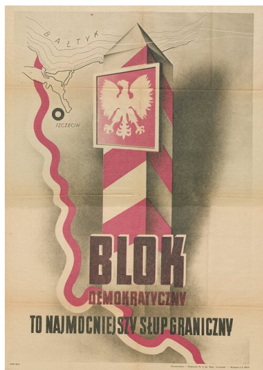
Plakat wyborczy tzw. Bloku Demokratycznego

Komuniści i związani z nimi figuranci rozpoczęli grę przedwyborczą w końcu 1945 r. Pierwszym pomysłem, mającym uniemożliwić realną ocenę posiadanych przez poszczególne partie wpływów w społeczeństwie, stała się koncepcja bloku wyborczego, obejmującego wszystkie działające na scenie politycznej legalne ugrupowania. Istotę propozycji określał proponowany podział mandatów. Dla PSL, partii najsilniejszej, przewidywano zaledwie 20% mandatów. Kontrpropozycja kierownictwa PSL, by dla „reprezentacji wsi” przeznaczyć 75% mandatów, została z kolei odrzucona przez wspólną reprezentację PPR i PPS, więc od marca 1946 r. stało się jasne, że podczas wyborów przeciwko komunistom i ich sojusznikom stanie tak PSL, jak i rosnące w siłę, a odrzucające umizgi ze strony komunistów (Popielowi w zamian za przystąpienie do Bloku Stronnictw Demokratycznych proponowano objęcie stanowiska ministra Ziem Odzyskanych) Stronnictwo Pracy.