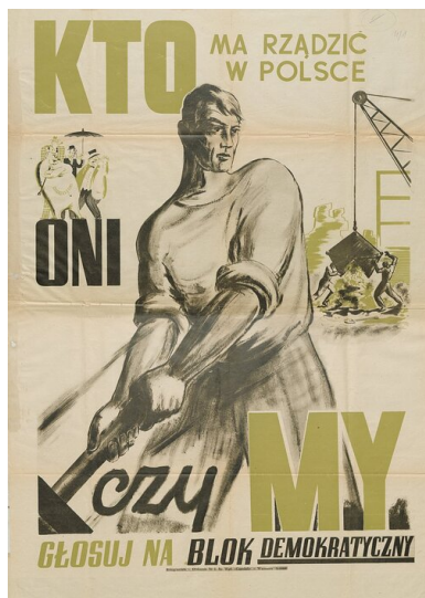
Plakat wyborczy tzw. Bloku Demokratycznego

środowisk opozycyjnych. W odniesieniu do Kościoła i środowisk z nim związanych rolę dywersyjną – a wręcz agenturalną – pełnił, mający swą trybunę w uruchomionym w końcu listopada piśmie „Dziś i Jutro”, Bolesław Piasecki.