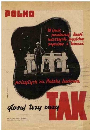
Plakat wzywający do głosowania „3 razy TAK” w referendum 30 czerwca 1946 r.