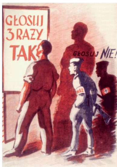
Plakat propagandowy z roku 1946 - Referendum 3 x TAK. Za czytającym, żołnierz NSZ, przedstawiony jako kolaborant hitlerowski, namawiający do głosowania na NIE

Jego podstawowym zadaniem miało być zorganizowanie wolnych i nieskrępowanych wyborów. Jednak zdominowany przez komunistów TRJN, mimo zobowiązań międzynarodowych, odwlekał termin ich ogłoszenia. Władze komunistyczne były wciąż niepewne swojej pozycji w kraju i rzeczywistych nastrojów społecznych. Miały ku temu podstawy.