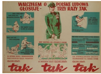
Plakat wzywający do głosowania za utrwaleniem nowych granic zachodnich