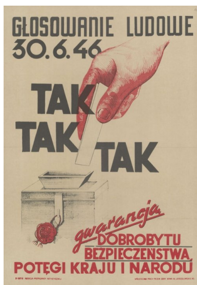
Plakat wzywający do głosowania 3 x Tak