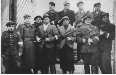
Funkcjonariusze PUBP i ORMO oddelegowani do zabezpieczenia referendum, 1946 r.

Wobec tłącego się w Polsce stanu wojny domowej niedziela 30 czerwca 1946 r. przebiegła względnie spokojnie. Oficjalne wyniki podano do publicznej wiadomości po prawie dwóch tygodniach. Generalny Komisarz głosowania ludowego oznajmił, że wzięło w nim udział ponad 90% uprawnionych, a na kolejne pytania twierdząco i w sposób ważny odpowiedziało: 68%, 77,2% i 91,4% głosujących. Ogłoszenie zawierało jedynie ogólne wyniki w skali kraju, nie przytoczono w nim natomiast żadnych częściowych rezultatów. Uniemożliwiono również ich publikację w oficjalnej prasie, a także przekazywanie do publicznej wiadomości na jakimkolwiek szczeblu.