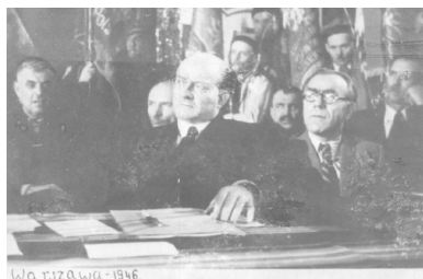
Konferencja organizacyjna PSL z udziałem prezesa - Stanisława Mikołajczyka, 1946 r.

Komisję Bezpieczeństwa z ministrem obrony narodowej Michałem Rola-Żymierskim na czele. Organ ten miał za zadanie koordynowanie działań wojska oraz aparatu bezpieczeństwa, rzuconych przeciwko opozycji oraz podziemiu. Natomiast w dniu głosowania miał sprawować nadzór nad jego przebiegiem w lokalach wyborczych. Za proces organizacji fałszerstw wyborczych odpowiadała sprowadzona z Moskwy specjalna grupa „doradców” – funkcjonariuszy Oddziału „D” Ministerstwa Bezpieczeństwa Państwowego ZSRS. Podczas narady z najwyższymi politykami strony polskiej uzgodniono kwestie preparowania dokumentów wyborczych, np. protokołów komisji, czy podrabiania podpisów ich członków.