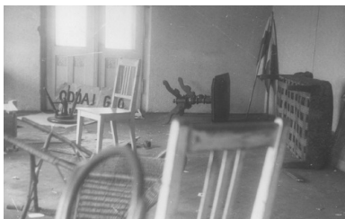
Fotografia zdemolowanego lokalu Polskiego Stronnictwa Ludowego w Szczecinie, 1946 r.

Wiosną 1946 r. zorganizowali oni wielką, ogólnokrajową akcję propagandową pod hasłem „3xTAK”. W zniszczonych przez wojnę polskich miastach i wsiach masowo pojawiły się napisy, plakaty, tablice i ulotki. Starając się wywołać jak najbardziej emocjonalną reakcję mieszkańców, przekonywały, że głosowanie przeciw grozi powrotem hitlerowców, krwiożerczych kapitalistów oraz obszarników. W swojej narracji jednoznacznie atakowały również podziemie niepodległościowe, łącząc je z byłymi okupantami. Opozycja, zarówno ta oficjalna, jak i podziemna, posiadała niewielkie możliwości oddziaływania na ludzi. Rządzący nie mogli sobie pozwolić na wizerunkową porażkę, stąd też pojawiły się ataki na głównego politycznego rywala – Polskie Stronnictwo Ludowe i jego prezesa Stanisława Mikołajczyka. Represje spadły na wielu działaczy legalnie działającego ugrupowania, którzy byli aresztowani, zastraszani, bici, a nawet skrytobójczo mordowani. W wielu miejscach dochodziło również do napadów i demolowania lokali PSL.