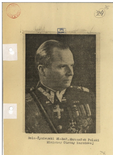
Michał Rola-Żymierski stojący na czele Państwowej Komisji Bezpieczeństwa, lata 40. XX w.