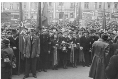
Wiec poparcia na Rynku Głównym w Krakowie w sprawie

Według badań, zgodnie z linią władzy, tj. „3xTak”, w skali całego kraju odpowiedziało jedynie ok. 27% osób. Rzeczywiste wyniki zobrazowały komunistycznym władzom faktyczne stosunki i nastroje panujące wśród Polaków. Ugruntowały również przekonanie, że przeprowadzenie rzeczywiście wolnych wyborów równałoby się utracie władzy. Referendum stało się katalizatorem przyspieszającym rozprawę z wszelkimi przeciwnikami sowieckich rządów w Polsce oraz doprowadzającym do zaostrzenia represji stosowanych wobec społeczeństwa.