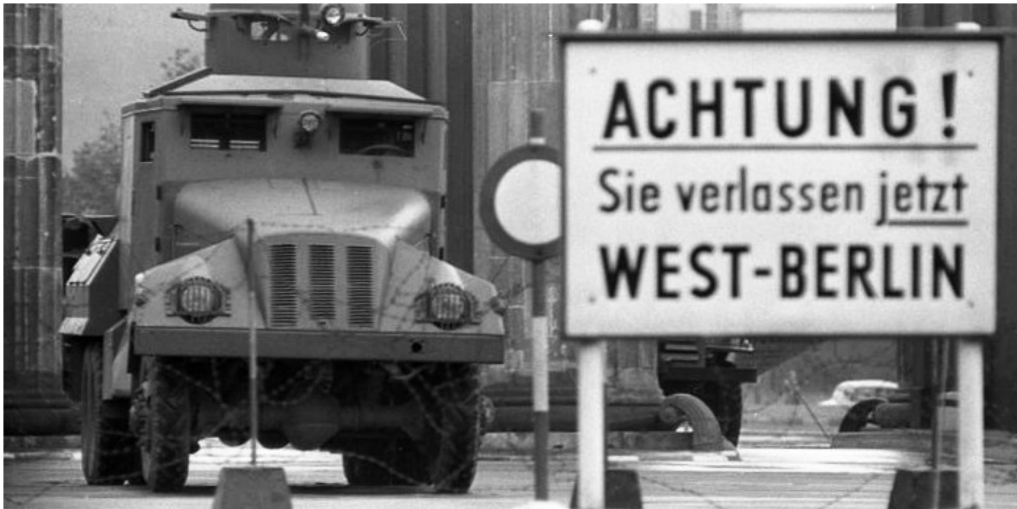
Granica stref okupacyjnych w Berlinie Zachodnim

https://przystanekhistoria.pl/pa2/tematy/radio-wolna-europa/97231,Ucieczka-Jozefa-Swiatlo-do-Berlina-Zachodniego.html