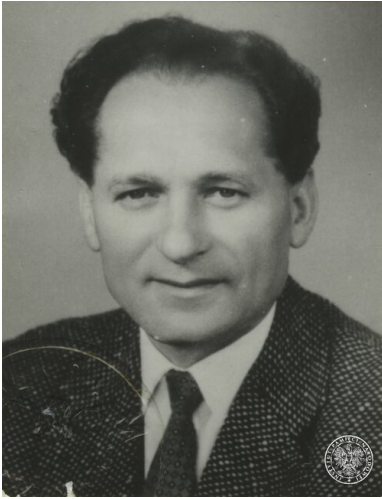
Mieczysław Moczar, członek KPP, PPR i PZPR.

Po uchwaleniu konstytucji komuniści zadekretowali swój monopol na sprawowanie władzy politycznej poprzez uchwalenie w sierpniu 1952 r. ordynacji wyborczej przewidującej, że liczba kandydatów miała być równa liczbie posłów.