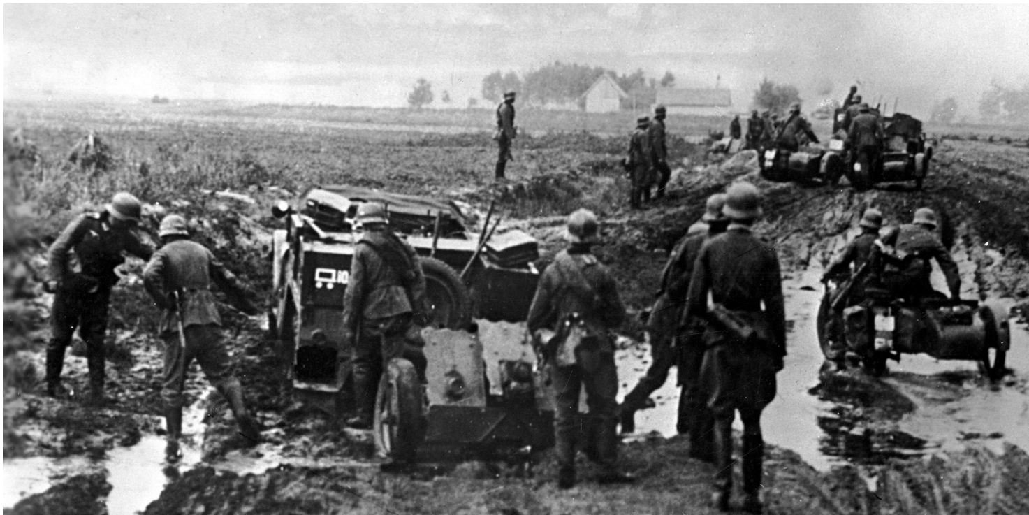
Kadr z niemieckiego filmu propagandowego o podboju Polski, 1939 r.

https://przystanekhistoria.pl/pa2/tematy/propaganda/94886,Niemy-swiadek-dzialan-wojennych-czyli-historia-pewnej-fotografii.html