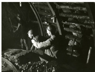
Górnicy podczas pracy przy wyrębie węgla na wyrobisku, ok. 1948 r.

Zaangażowani w „wyścig pracy” robotnicy otrzymywali anonimy, najczęściej z pogrózkami i wezwaniami do zaprzestania współzawodnictwa. Podrzucano je przodownikom do szafek w szatni, toreb lub skrzynek pocztowych w miejscu zamieszkania, część zaś wysyłano pocztą.