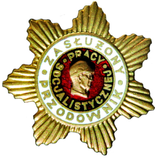
Złota odznaka Zasłużonego Przodownika Pracy Socjalistycznej, wzór 1974 z wizerunkiem Wincentego Pstrowskiego. Zbiory prywatne