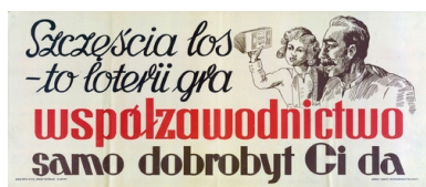
Afisz propagandowy z 1951 r.

Gniew i frustrację wyładowywano również na wizerunkach przodujących robotników tworzących „aleje przodowników pracy” ustawiane przed zakładami pracy. Niszczono także tablice, na których wywieszano nazwiska pracowników niewykonujących swoich norm. We wrześniu 1952 r. ktoś wysmarował ludzkim kałem taką tablicę, umieszczoną przed wejściem do kopalni „Gliwice”. W odpowiedzi na wprowadzenie nowych norm produkcyjnych w przemyśle wydobywczym, w październiku 1950 r. nieznani sprawcy przy użyciu podobnej materii zbezczeszili grób Wincentego Pstrowskiego na cmentarzu przy ul. Józefa w Zabrze.