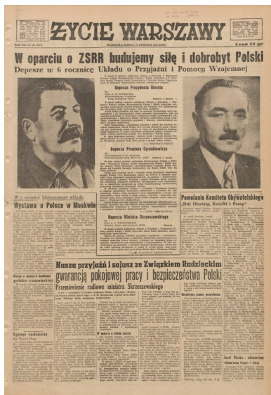
Strona tytułowa Życia Warszawy z 21 kwietnia 1951 r.