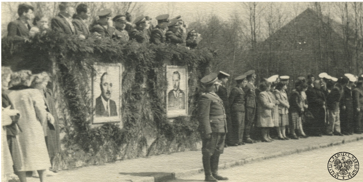
Portrety Bolesława Bieruta i Konstantego Rokossowskiego przywieszone do trybuny honorowej podczas obchodów święta 1 Maja w jednostce wojskowej w Dziwnowie w 1950 r.

https://przystanekhistoria.pl/pa2/tematy/propaganda/82051,Wokol-kultu-Bieruta.html