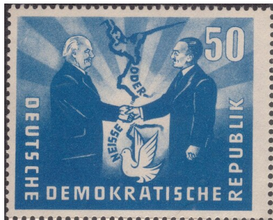
Wschodnioniemiecki znaczek pocztowy z Friedrichem Wilhelmem Reinholdem Pieckiem i Bolesławem Bierutem - 1951 r. (domena publiczna)

kłamiąc np., że na początku wojny kierował on pod Kijowem w ramach ofiarnej pracy dla Kominternu poważną, międzynarodową grupą uchodźców wojennych, to jednak właściwie tylko uroczyste obchody sześćdziesiątej rocznicy jego urodzin z 1952 r. zapisały się w pamięci historycznej jako modelowe przykłady stalinowskiego kultu jednostki à la polonaise .