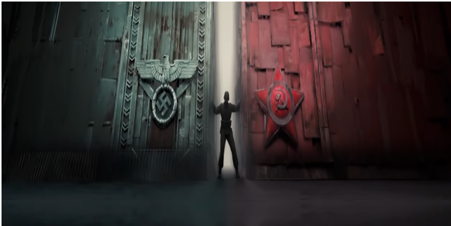
Kadr z filmu IPN „Niezwyciężeni”

https://przystanekhistoria.pl/pa2/tematy/propaganda/79873,Czy-po-uderzeniu-Niemiec-na-Polske-panstwo-polskie-przestalo-istniec.html