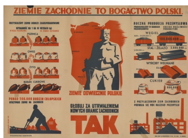
Plakat propagandowy z kampanii referendalnej w 1946 r.

Skutkiem tego przyznane pierwotnie gospodarstwo o powierzchni 8,35 ha gruntu rolnego, 1,5 ha łąki, 0,13 ha ogrodu oraz 0,12 ha sadu (?) – łącznie ponad 10 ha – zostało ograniczone do 7,79 ha.