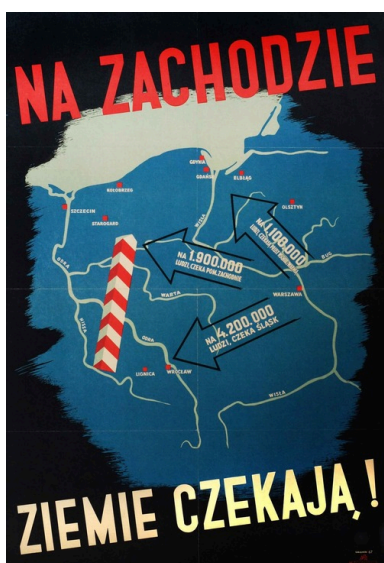
Plakat propagandowy Mieczysława Teodorczyka „Na zachodzie ziemie czekają!”, 1945 r.

Wspomniane akcje wysiedleńcze (zwane eufemistycznie „repatriacją” lub „ewakuacją”) teoretycznie były dobrowolne, w praktyce jednak dobrowolność ta bywała fikcyjna. Wysiedleńcy z Kresów Wschodnich mogli wziąć ze sobą odzież, obuwie, bieliznę, pościel, żywność, pomniejsze sprzęty domowe, inwentarz, ale nie mogli zabrać mebli, pieniędzy (powyżej 1000 rubli na osobę), złota, surowych kamieni szlachetnych, dzieł sztuki, a także samochodów. Za mienie pozostawione w rodzinnych stronach mieli uzyskać zwrot wartości od polskiego rządu.