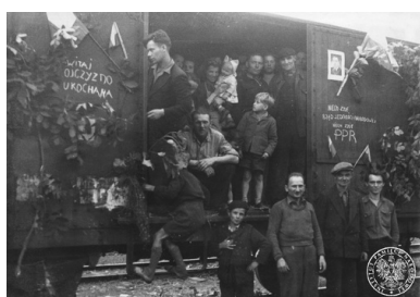
Wagon z ludźmi na jednej ze stacji kolejowych. Fotografia z albumu Państwowego Urzędu Repatriacyjnego, 1945-1946 r.

W lipcu 1944 r., w czasie postępującej ofensywy Armii Czerwonej na zachód, Polski Komitet Wyzwolenia Narodowego zawarł z Moskwą umowę dotyczącą granicy polsko-sowieckiej. Umowa ta, podpisana wbrew legalnemu polskiemu rządowi w Londynie, sankcjonowała utratę wschodnich ziem RP na rzecz ZSRS jeszcze przed formalnymi decyzjami podjętymi przez wielkie mocarstwa na kolejnej konferencji – w Jałcie.