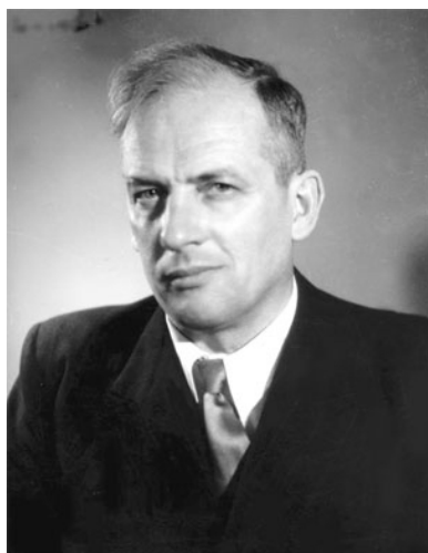
Jerzy Putrament