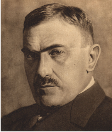
Tadeusz Boy-Żeleński

Była grupą odpowiedzialną za wprowadzanie totalitarnej dominacji w polskiej kulturze w postaci tzw. socrealizmu, który obowiązywał w kulturze i sztuce od 1948 do 1953 roku. Nie darmo pismo założone w latach czterdziestych, w którym wykuwano nowy kształt sowieckiej Polski, nazywało się „Kuznica”, a w jego skład wchodził ci sami ludzie znani już ze Lwowa: Ważyk, Lec, Jastrun, Przyboś, Kott, Rudnicki, Strykowski, a także Stefan Żółkiewski, Adam Schaff, Kazimierz Brandys. Byli to nadal kolaboranci w takim czy innym rozumieniu, czy to wyznawcy ideologii komunistycznej, czy też wprost wysługujący się władzy sowieckiej, którzy, co gorsza, stali się założycielami przyczółków sowieckiej władzy w Polsce. Wspólnie dokonywali w Polsce sowieckiej rewolucji.