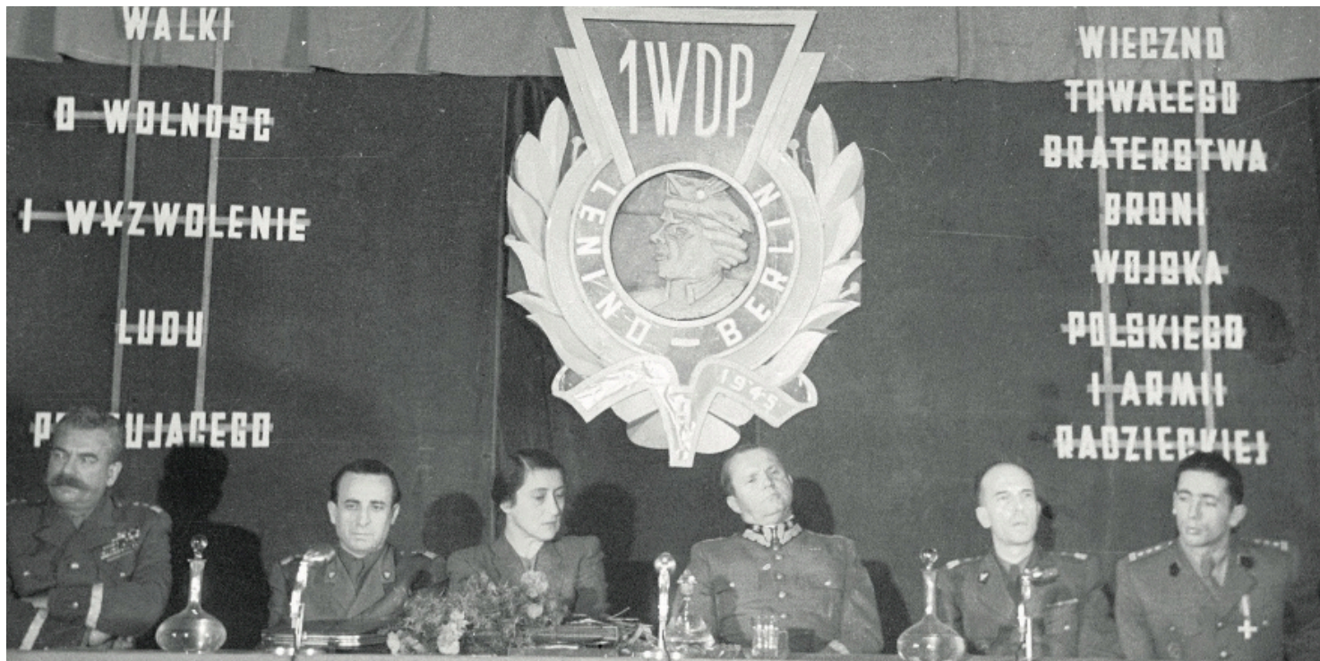
Wanda Wasilewska, deputowana do Rady Najwyższej ZSRS, wśród oficerów I Dywizji Piechoty im. Tadeusza Kościuszki, Warszawa 1948 r.

https://przystanekhistoria.pl/pa2/tematy/propaganda/101908,Odcienie-zdrady-Poczatki-literatury-okresu-PRL.html