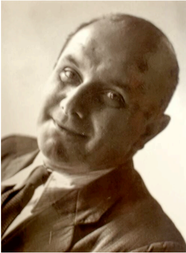
Stanisław Jerzy Lec