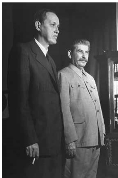
Harry Hopkins i Józef Stalin, 1941