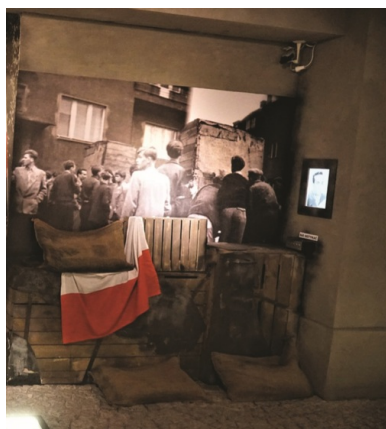
Muzeum Powstania Poznańskiego - Czerwiec 1956; fragment

Wraz z narodzinami III RP można było zacząć jawnie i głośno mówić o poznańskim roku 1956. Wówczas też coraz częściej zaczęto zwracać uwagę na to, że mimo obecności w przestrzeni miejskiej pomników oraz podejmowania działań upamiętniających Czerwiec '56 nadal brakuje miejsca, w którym można by poznać i przeżyć historię „czarnego czwartku”. Uczestnicy wydarzeń zgodnie uważali, że najwłaściwszą formą upamiętnienia ich nierównej walki z komunistami byłoby muzeum.