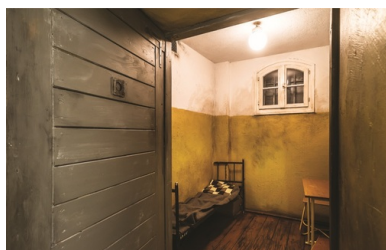
Zrekonstruowana cela więzienna, w której przetrzymywano uczestników Poznańskiego Czerwca.

Z ulic można przejść do kolejnych pomieszczeń. Prezydialna sala Komitetu Wojewódzkiego Polskiej Zjednoczonej Partii Robotniczej wypełniona propagandowymi plakatami, Wojewódzki Urząd ds. Bezpieczeństwa Publicznego z symboliczną salą przesłuchań, celą i sądem – wszystkie te miejsca tworzą spójną opowieść o Czerwcu '56. Twórcom ekspozycji przyznano Grand Prix i statuetkę „Izabelli” w konkursie na wydarzenie muzealne roku 2007 w Wielkopolsce 10 .