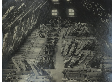
Wypełnione zdobycznymi płatowcami wewnątrz hali sterowcowej w podpoznańskich Winiarach, 1919 r.

Nasz bohater, który miał swój udział w zdobyciu przez powstańców lotniska w Ławicy w nocy z 5 na 6 stycznia 1919 roku, z miejsca został mianowany jej pierwszym polskim komendantem. Już nazajutrz – jak pisał po latach nie kryjąc wzruszenia –