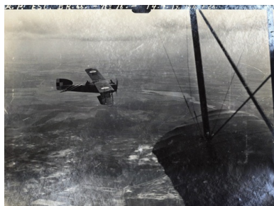
Samolot Bréguet XIVB2 w polskim malowaniu nad Wielkopolską, 14 lipca 1919 r.