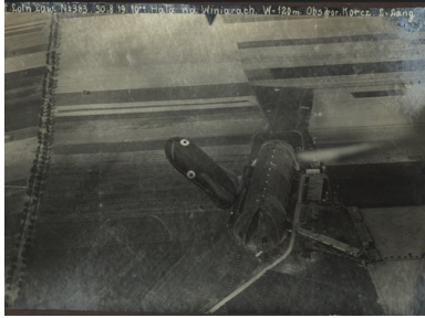
Hala sterowcowa w podpoznańskich Winiarach (tzw. hala Zeppelina), sierpień 1919 r.