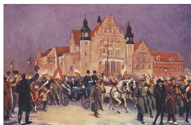
L. Prauziński, Szturm powstańców na budynek Prezydium Policji 27 XII 1918 r. Pocztówka ze zb. Biblioteki Narodowej