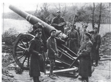
Działo „Barbara” z baterii artylerii ciężkiej na stanowisku pod wsią Zatom Stary k. Międzychodu, luty 1919 r.