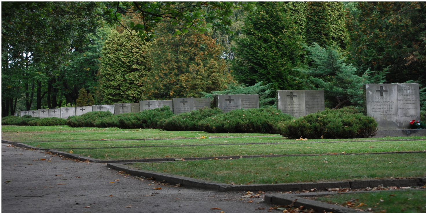
Cmentarz Powstańców Warszawy (2009).

https://przystanekhistoria.pl/pa2/tematy/powstanie-warszawskie/96966,Nekropolia-Powstania-Warszawskiego.html