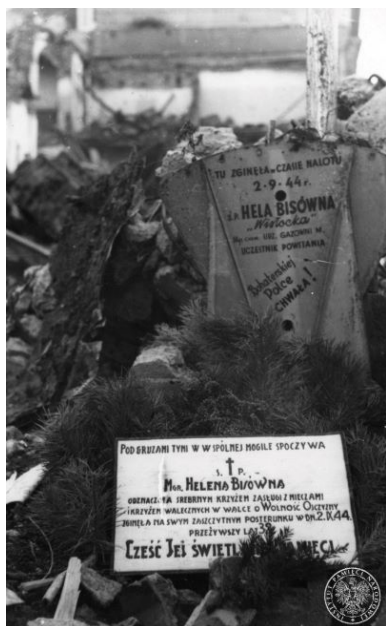
Groby z okresu Powstania. Warszawa, pl. Trzech Krzyży róg Wiejskiej.