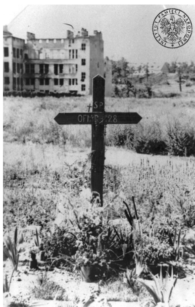
Zbiorowy grób 128 osób