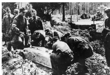
Pogrzeb Powstańca.

Tymczasowe groby wypełniały ulice, place, kanały i podwórka budynków. Znaczna ich część została odsłonięta podczas nalotów, bombardowań i dalszych powstańczych potyczek. W drugiej połowie tego roku Biuro Odbudowy Stolicy ustaliło, że zwłoki będą składane w pobliżu parku im. gen. Józefa Sowińskiego na Woli.