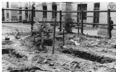
Groby na podwórzu w Warszawie, 1945 r.

Podobnie jak inne miejsca pochówku w stolicy cmentarz administracyjnie podlegał władzom miejskim, jednak faktyczną zwierzchność i kontrolę nad nim sprawował Związek Bojowników o Wolność i Demokrację. To właśnie ta organizacja decydowała, jakie nazwiska mogą się pojawić na tablicach, a jakie są zdecydowanie na cmentarzu niepowołane. Działo się tak nawet w przypadku zidentyfikowania pochowanej osoby.