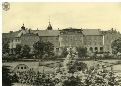
Zamek Królewski od strony Wisły przed zbombardowaniem, 1939 r.

drang nach Osten i zdobywania przestrzeni życiowej dla Niemców.