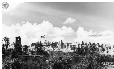
Ruiny Zamku Królewskiego i Starego Miasta. Panorama od strony Wisły

Z chirurgiczną precyzją Niemcy realizowali swój morderczy plan. Przyczynili się do ogromnych zniszczeń zabudowy miejskiej: Stare Miasto zostało zrównane z ziemią, wysadzono Zamek Królewski, kolumnę Zygmunta, palono bezcenne zbiory (zgromadzone w stołecznych bibliotekach i archiwach), zniszczono obiekty strategiczne pod względem politycznym i gospodarczym, palono fabryki i zakłady produkcyjne. Miała też miejsce zakrojona na szeroką skalę grabież mienia i dóbr kultury.