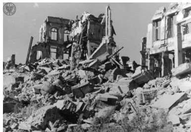
Ruiny domów w okolicach Arsenału w 1946 r.

Naród żyje tak długo, jak długo żyją dzieła jego kultury – tak mówili wówczas Niemcy. I, zgodnie z tym hasłem, ze szczególną zaciekłością, dewastowali i niszczyli miejsca szczególne dla polskiej historii, kultury i tradycji: zabytki, kościoły i obiekty kultu religijnego, archiwa, biblioteki, muzea i pomniki.