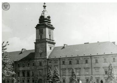
Zamek Królewski w Warszawie przed zbombardowaniem, 1939 r.

Niemcy nigdy nie zamierali dotrzymać, złożonej 2 października, po kapitulacji Powstania Warszawskiego, obietnicy oszczędzenia ocalałych po walkach powstańczych zabudowań stolicy ze „szczególnym uwzględnieniem obiektów o dużej wartości historycznej, kulturalnej lub duchowej”. Była to cyniczna gra z wykrwawionym miastem.