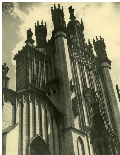
Fronton i wieżyczki katedry św. Jana w Warszawie, 1939 r.

Wybuch Powstania Warszawskiego stał się dla Hitlera okazją do rozwiązania „sprawy polskiej”. Nie zmieniły tego formalne obietnice złożone stronie polskiej w akcie kapitulacji podpisanym 2 października. Ostatnim akordem rozprawienia się z Polakami i wcielenia w życie niemieckich planów była ogłoszona 9 października decyzja o zburzeniu Warszawy.