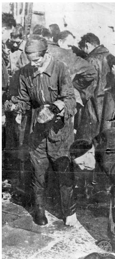
Polacy - więźniowie Niemców w Durchgangslager 121 Pruszków.