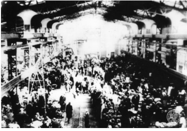
Wnętrze jednej z hal pofabrycznych w Durchgangslager 121 Pruszków.

Po przybyciu do Dulagu odbywała się selekcja. Niemcy z brutalnością rozdzielali całe rodziny. Uznanych za zdolnych do pracy, głównie między 16 a 60 rokiem życia, kierowano na roboty przymusowe w głąb Rzeszy. Codziennie z Dulagu odchodziły transporty do miejsc docelowych. Wytypowani do obozów koncentracyjnych odjeżdżali ze stacji w Pruszkowie w bydłych wagonach. Części udawało się zbiec i znaleźć schronienie w pobliskich gospodarstwach. Osoby chore, niepełnosprawne, starsze oraz kobiety w ciąży i matki z dziećmi uznawano za niezdolne do pracy i wysyłano transportami na tereny Generalnego Gubernatorstwa. Pomoc dla wywożonych na teren Generalnego Gubernatorstwa organizowała krakowska centrala RGO. W związku z rozdzielaniem rodzin polski personel pomagał wypędzonym w uzyskiwaniu informacji o losach ich członków, przekazując poza obóz informacje o poszukiwanych.