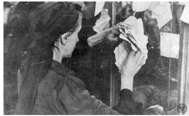
Poszukiwanie bliskich: kobieta umieszczająca na ścianie ogłoszenie.