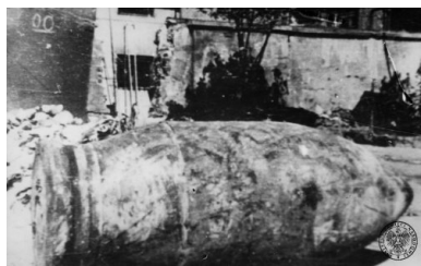
Niewybuch pocisku kal. 600 mm z niemieckiego najcięższego moździerza samobieżnego (60cm Mörser "Karl" Gerät 040, najprawdopodobniej pojazd nr VI [Gerät VI] "Ziu" z 638. baterii