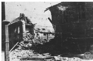
Budynek mieszkalny przy ul. Jasnej zbombardowany przez niemieckie samoloty w czasie Powstania Warszawskiego.

Po dwukrotnej zmianie lokalu mego biura w północnej części Śródmieścia przeszedłem w porozumieniu z kom. Monterem po upadku Powiśla do południowej części, gdzie w lokalu przy ul. Wilczej dotrwałem do kapitulacji. Przede mną przeniosły się na ten teren moje władze centralne oraz wojskowy szef zaopatrzenia, w pobliżu którego musiało się znajdować moje biuro.