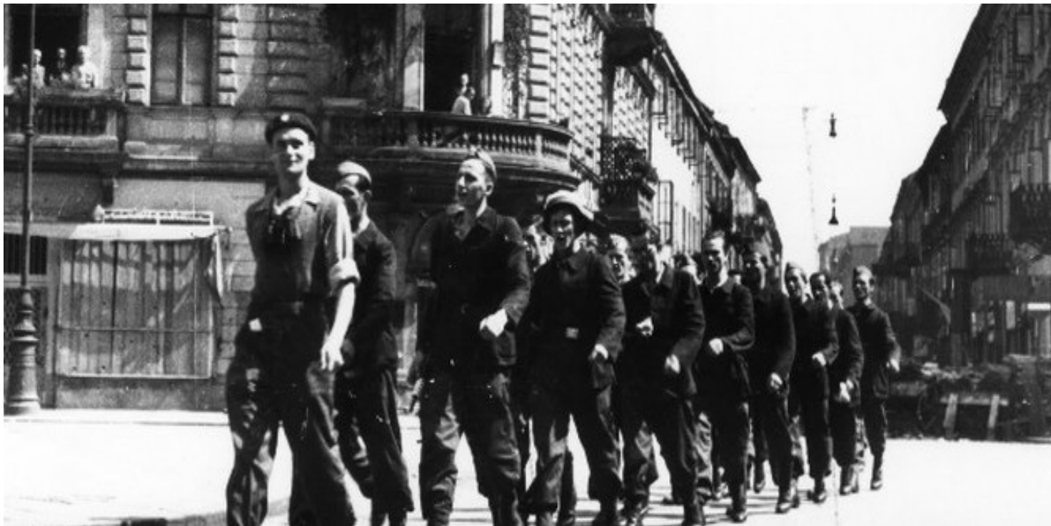
Wymarsz oddziału „Chwatów” w Śródmieściu

https://przystanekhistoria.pl/pa2/tematy/powstanie-warszawskie/72243,Pierwsza-depesza-powstanczej-Warszawy.html