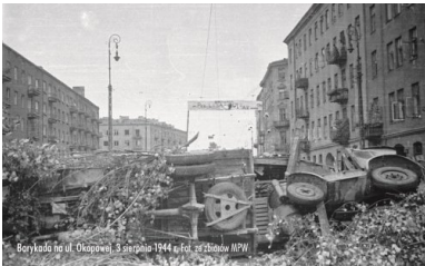
Barykada na ul. Okopowej, 3 sierpnia 1944 r.

W kilka chwil byłyśmy gotowe, „Monika” chwyciła pośpiesznie coś do jedzenia na drogę (zasadniczo każda miała zabrać dla siebie jedzenie na 24 godziny, ale teraz nie było już czasu na wracanie do domu lub kupowanie) i kolejno (konspiracja!) wybiegłyśmy na ulicę.