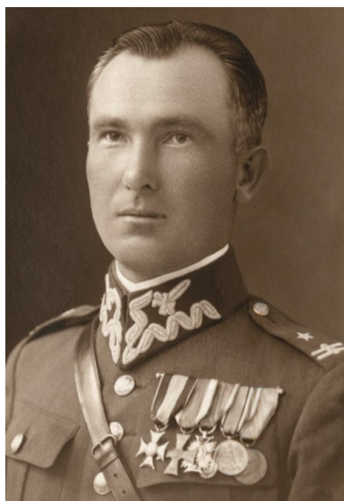
Mjr Antoni Chruściel, 1926 r.

Warto więc przypominać postać gen. „Montera”. Nie tylko dowódcy Powstania, lecz także osoby niezwykle zasłużonej dla rozwoju konspiracji w Warszawie. Człowieka, który na stałe zapisał się w dziejach Stolicy i w historii Polski.