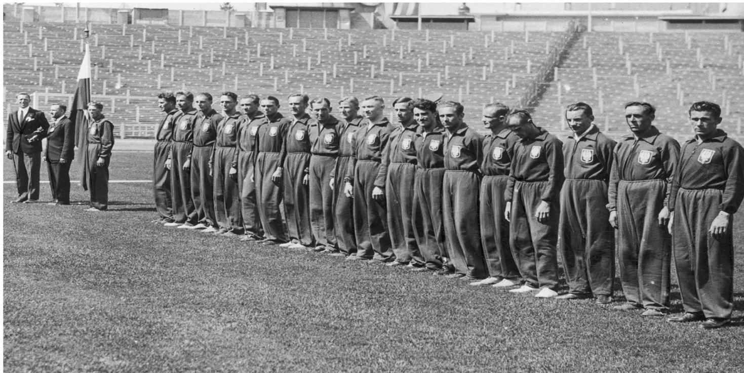
Eugeniusz Lokajski w składzie reprezentacja Polski podczas meczu lekkoatletycznego Belgia - Polska w Brukseli, lipiec 1935 r.

https://przystanekhistoria.pl/pa2/tematy/powstanie-warszawskie/102544,Portrecista-powstania-Eugeniusz-Lokajski.html