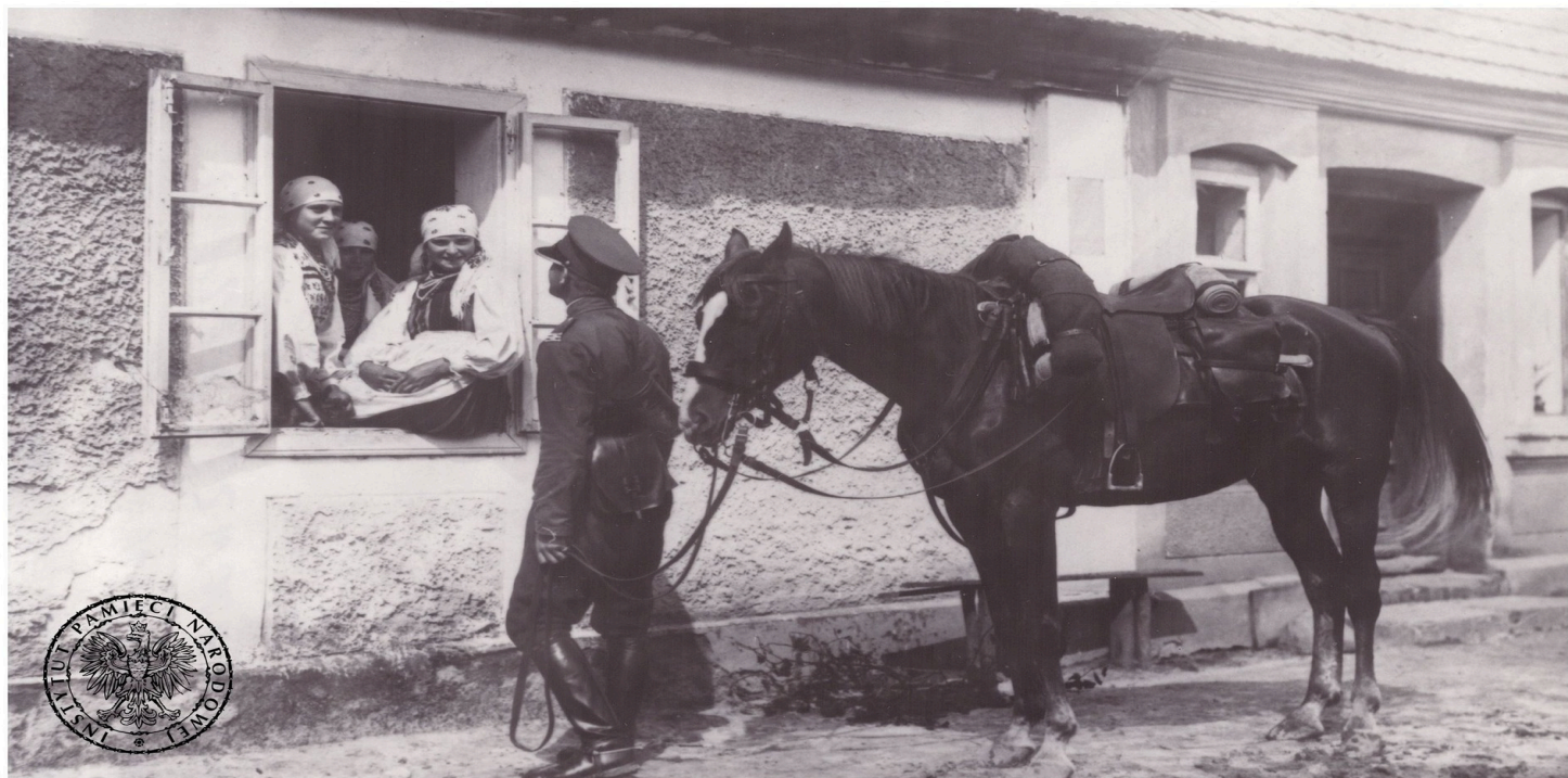
Szwolczer z 1. Pułku Szwolczerów Józefa Piłsudskiego podczas rozmowy z dziewczętami.

https://przystanekhistoria.pl/pa2/tematy/polskie-wojsko/98583,Kawaleria-II-RP.html