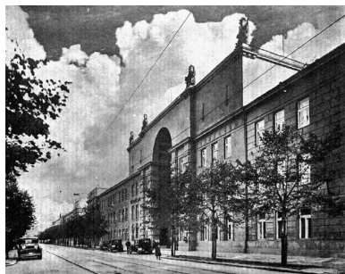
Gmach Ministerstwa Spraw Wojskowych przy ul. 6 sierpnia w Warszawie, 1933 r.

W MSWojsk. służył do 6 marca 1922 r. Bywał mylony z innym oficerem o tym samym imieniu i nazwisku, który posiadał także stopień kapitana, lecz służył w artylerii (4. dywizjonie artylerii ciężkiej) – 28 czerwca 1920 r. w tej sprawie interweniowali jego przełożeni z MSWojsk., prostując błędny zapis w „Dzienniku Personalnym”. Już po zakończeniu wojny z dowództwa 1. DP Leg. wyszedł wniosek awansowy dla Świtalskiego na stopień majora, skierowany do Komisji Weryfikacyjnej gen. por. Władysława Sikorskiego; wniosek dotarł jednak za późno (6 października 1921 r.) i nie był w ogóle rozpatrywany.