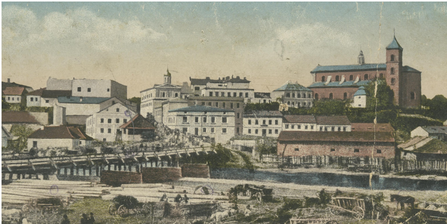
Panorama Gorlic na pocztówce z 1915 r.

https://przystanekhistoria.pl/pa2/tematy/polskie-wojsko/89804,Adam-Switalski-tytularny-general-brygady-AK-wiezien-obozow-NKWD.html