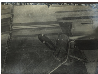
Hala sterowcowa w podpoznańskich Winiarach (tzw. hala Zeppelina), sierpień 1919 r.