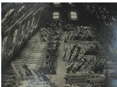
Wypełnione zdobycznymi płatowcami wnętrze hali sterowcowej w podpoznańskich Winiarach, 1919 r.

Nasz bohater, który miał swój udział w zdobyciu przez powstańców lotniska w Ławicy w nocy z 5 na 6 stycznia 1919 roku, z miejsca został mianowany jej pierwszym polskim komendantem. Już nazajutrz – jak pisał po latach nie kryjąc wzruszenia –