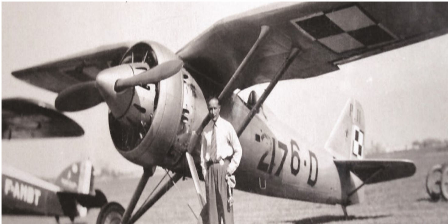
Płk Jerzy Kossowski.

https://przystanekhistoria.pl/pa2/tematy/polskie-wojsko/76319,Zapomniany-bohater-Pulkownik-pilot-Jerzy-Kossowski-18921939.html