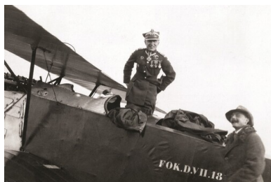
Płk Jerzy Kossowski w kabynie myśliwca Fokker D.VII 18-7; zdjęcie wykonane prawdopodobnie na lotnisku w Lidzie między majem a wrześniem 1925 r.

Lotniczych 12 . W 1930 r. zaprezentował możliwości samolotu PZL P.1 na pokazie lotniczym w Bukareszcie, za co otrzymał powinszowanie od króla Karola II. W 1932 r. uczestniczył w Międzynarodowych Popisach Lotniczych w Cleveland (USA), pilotując myśliwiec PZL P.11. Pięć lat później zakończył współpracę z lotnictwem cywilnym i zamieszkał w Bydgoszczy.