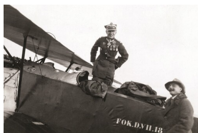
Płk Jerzy Kossowski w kabinie myśliwca Fokker D.VII 18-7; zdjęcie wykonano prawdopodobnie na lotnisku w Lidzie między majem a wrześniem 1925 r.

Lotniczych 12 . W 1930 r. zaprezentował możliwości samolotu PZL P.1 na pokazie lotniczym w Bukareszcie, za co otrzymał powinszowanie od króla Karola II. W 1932 r. uczestniczył w Międzynarodowych Popisach Lotniczych w Cleveland (USA), pilotując myśliwiec PZL P.11. Pięć lat później zakończył współpracę z lotnictwem cywilnym i zamieszkał w Bydgoszczy.