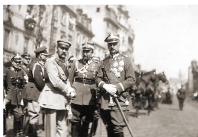
Józef Piłsudski, Tadeusz Rozwadowski, Kazimierz Sosnkowski, 1923 r.