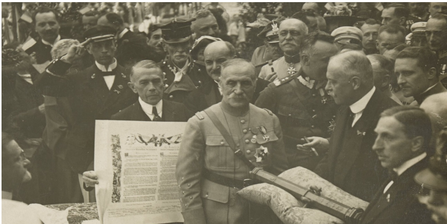
Ferdynand Foch w Warszawie, 1923 r. Fot. Biblioteka Narodowa

https://przystanekhistoria.pl/pa2/tematy/polskie-wojsko/76073,Wrog-Niemiec-przyjaciel-Polakow.html