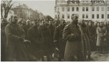
Gen. Lucjan Żeligowski z żołnierzami w Wilnie, 1920 r.