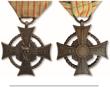
Awers i rewers Krzyża Zasługi Wojsk Litwy Środkowej.