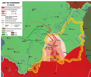
Mapa przedstawiająca przebieg działań w czasie „Buntu” gen.

Zawieszenie broni między Litwą Środkową a Republiką Litewską, zwaną też wówczas potocznie Litwą Kowieńską, nastąpiło 29 listopada 1920 r. W 1922 r. odbyły się wybory do Sejmu Wileńskiego, w których wzięli udział głównie Polacy, dominujący na tym obszarze. Podczas pierwszego posiedzenia nowego parlamentu przyjęto uchwałę o przyłączeniu Litwy Środkowej do Polski, co nastąpiło w kwietniu 1922 r. Z kolei 15 marca 1923 r. Konferencja Ambasadorów Ligi Narodów uznała wschodnie granice Polski, przyjmując linię demarkacyjną między Polską a Litwą za obowiązującą granicę między obydwojma państwami. Jednak jeszcze do maja 1923 r. dochodziło do poważnych potyczek między polską policją i jednostkami Straży Granicznej a bojówkami litewskich szaulisów.