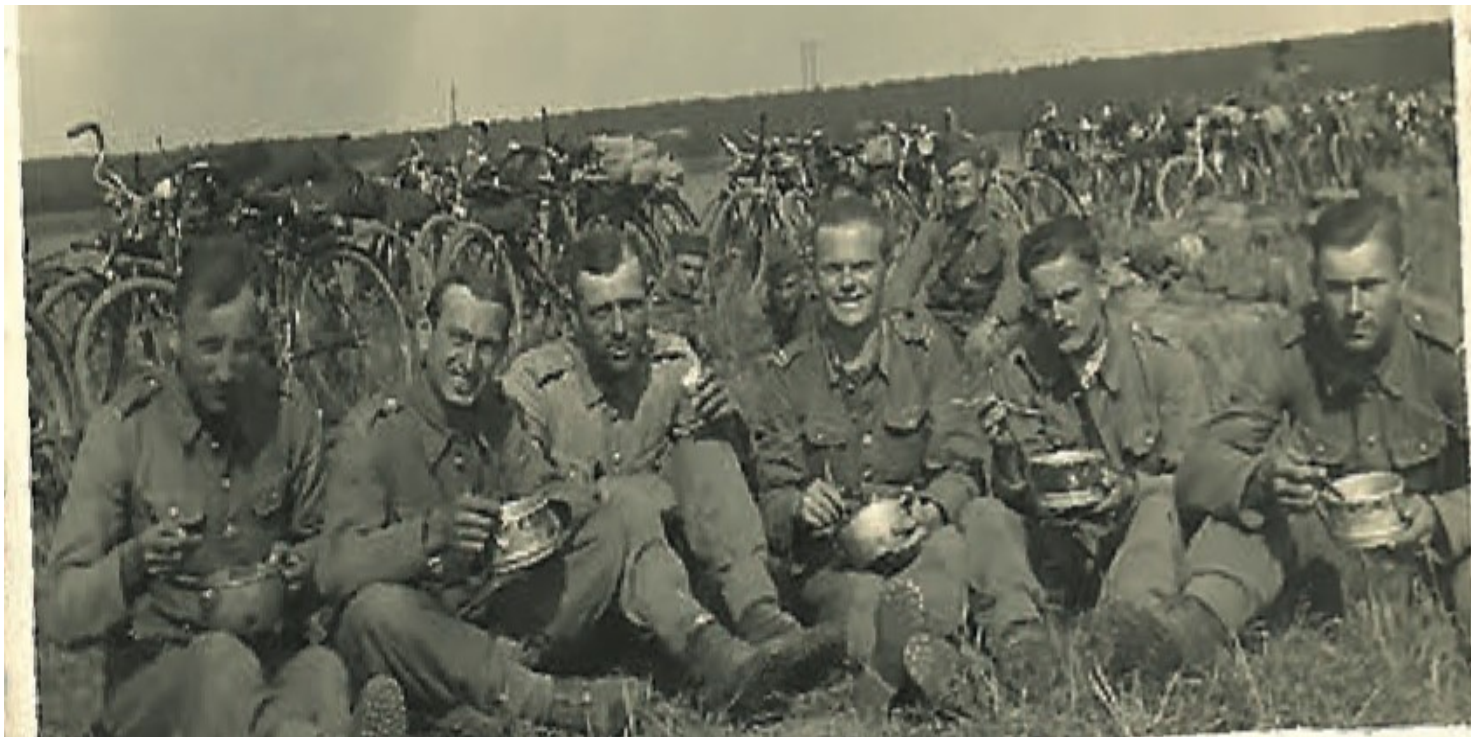
Żołnierze Batalionu Fortecznego KOP nad Słuczą, sierpień 1939 r.

https://przystanekhistoria.pl/pa2/tematy/polskie-wojsko/74333,Hekatomba-na-Polesiu-Losy-4-kompanii-Batalionu-Fortecznego-KOP-Sarny-i-poszukiwa.html