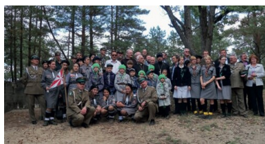
Rekonesans historyczny z harcerzami z Hufca Wołyń na Łysej Górze (okolice Tynnego), lato 2011 r.

Miejscowa ludność niechętnie udzielała wówczas informacji – wszak byłem obcy, pytałem o rok 1939. Często opowieści były z sobą sprzeczne i odsuwały mnie od ustalenia, gdzie znajdują się miejsca pochówku żołnierzy KOP poległych i zamordowanych przez NKWD. Być może ludzie nie chcieli wracać do tych wspomnień, może niewiele wiedzieli, może nie byli pewni, czy nie chodzi mi o ofiary ukraińskich rzezi z 1943 r., do których doszło także w Tynnem 16 , a może były to osoby, które osiedlono w Tynnem już po wojnie.