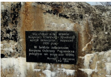
Tablica pamiątkowa poświęcona żołnierzom KOP na ścianie schronu w Tynnem.

Zanim doszło do agresji sowieckiej, żołnierze batalionu KOP „Sarny” czekali na przetrzucenie transportem kolejowym na front zachodni. Po zbombardowaniu przez Niemców 16 września stacji w Równem, a wkrótce przez Sowietów węzła w Sarnach ruch kolejowy na linii Sarny-Równe ustał.