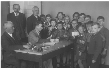
Dzieci ze szkoły powszechnej im. Tadeusza Kościuszki w Szczakowej dają datki pieniężne na Fundusz Obrony Narodowej,