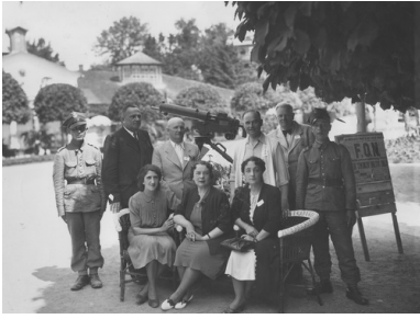
Orkiestra zdrojowa w Truskawcu, która wykonała dwa koncerty na rzecz Funduszu Obrony Narodowej, sierpień 1938 r.