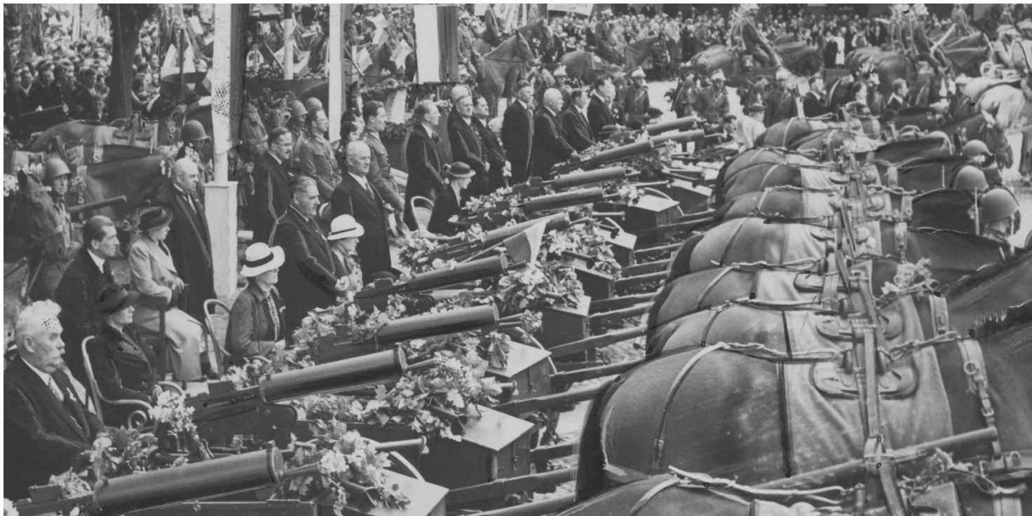
Przekazanie wojsku ckm-ów ufundowanych przez komitet Funduszu Obrony Narodowej w Nowym Tomyślu, lipiec 1938 r.

https://przystanekhistoria.pl/pa2/tematy/polskie-wojsko/72441,Fundusz-Obrony-Narodowej-w-39-pulku-piechoty-Strzelcow-Lwowskich.html