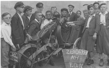
Uczniowie szkoły powszechnej w Mosinie zbierają surowce wtórne w celu uzyskania pieniędzy na Fundusz Obrony Narodowej, 11 czerwca 1939 r.

Za tak okazaną gotowość niesienia ofiar na rzecz obrony Państwa składam w imieniu służby oficerom, podoficerom i strzelcom pułku gorące podziękowania”.