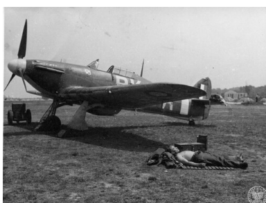
Samolot Hawker Hurricane Mk. I - podstawowe wyposażenia polskich dywizjonów myśliwskich w okresie Bitwy o Anglię.