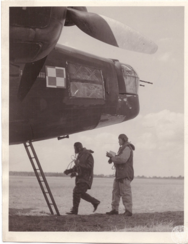
Polscy lotnicy wsiadający do bombowca Vickers Wellington.

Druga faza Bitwy rozpoczęła się 8 sierpnia 1940 roku, kiedy to Luftwaffe rozszerzyła swe działania o ataki skierowane przeciwko brytyjskiemu lotnictwu oraz portom. Niemcy dążyli do zniszczenia lotnictwa RAF. Niemieckie bombowce prowadziły w tym czasie nocne ataki na cele wojskowe, które były preludium późniejszego nocnego Blitzu.