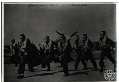
Piloci Dywizjonu 303 biegnący do samolotów.