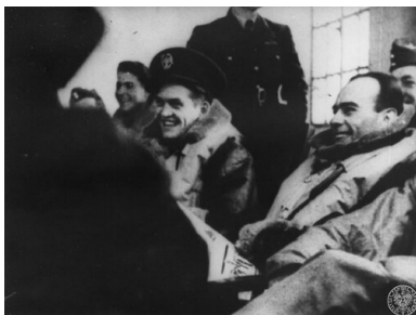
Polscy piloci przed startem. Kadr z filmu „Biały Orzeł”.