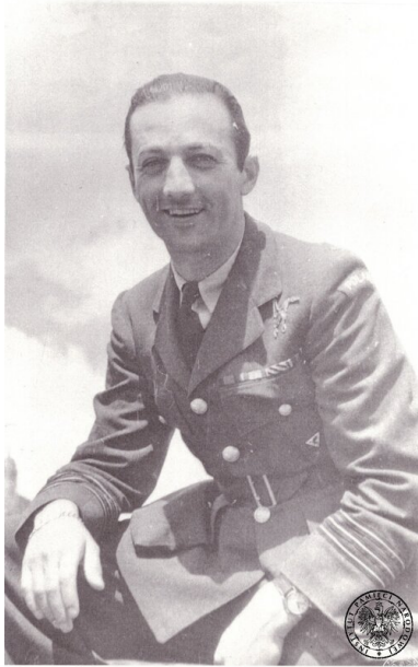
Pil. TADEUSZ SAWICZ - dowca 315 Dywizjonu

Tadeusz Władysław Sawicz, uczestnik Bitwy o Anglię. W późniejszym okresie dowódca Dywizjonu 315.