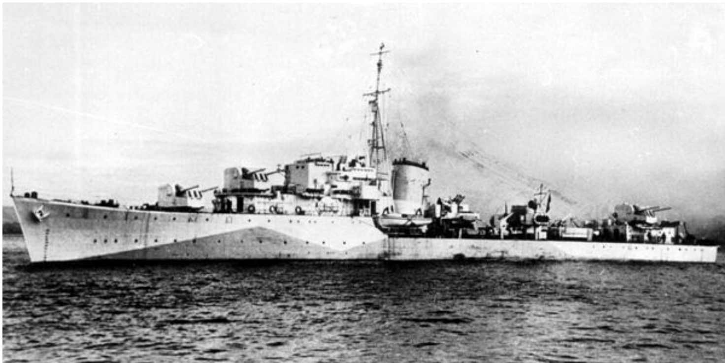
ORP "Orkan".

https://przystanekhistoria.pl/pa2/tematy/polskie-wojsko/68523,Trzy-rejsy-niszczyciela-ORP-Orkan.html