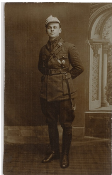
Witold Pilecki - harcerz, ochotnik w Samoobronie Wileńskiej w 1918 roku, żołnierz 13. pułku ułanów na froncie bolszewickim w roku 1919, w 1920 r. żołnierz 1. Wileńskiej Kompanii Harcerskiej 201. Ochotniczego pp, obrońca