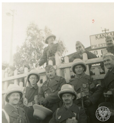
Żołnierze Legii Oficerskiej na Środkowym Wschodzie w drodze

Tu pierwsze oddziały zmotoryzowane przechodziły gruntowne przeszkolenie w walkach pustynnych. Wyszukanie Polaków zwróciło uwagę Brytyjczyków, którzy zaplanowali wysłanie ich do Grecji – Wavell 25 lutego poinformował o tym Kopańskiego. Brygada została przeniesiona do Aleksandrii, skąd miała popłynąć do Aten. Na pokłady transportowców zostały załadowane pododdziały artylerii, rzut kwaterunkowy i część sztabu brygady, ale 9 kwietnia przerzut do Europy został odwołany. Cała brygada powróciła w rejon koncentracji. Przyczyną nagłej zmiany decyzji był upadek Grecji w wyniku niemieckiego blitzkriegu, co zdezaktualizowało wysłanie SBSK – i całe szczęście pamiętając o tragicznym losie Podhalańczyków.