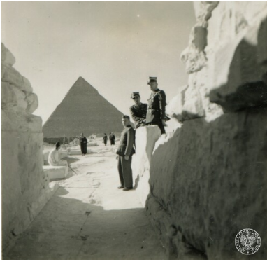
Żołnierze Samodzielnej Brygady Strzelców Karpackich na tle piramidy Chefrena w Gizie, luty 1941.