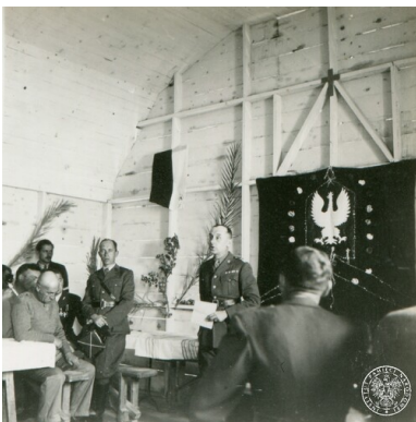
Gen. Stanisław Kopański,

Pierwsi żołnierze polscy przybyli do Libanu i Syrii, gdzie dowództwo francuskie najpierw zorganizowało obóz szkoleniowy nad rzeką Orontes (obecnie Nahr al-Asi). Następnie sztab francuskiej Armii Lewantu wyznaczył teren obok obozu Legii Cudzoziemskiej w Homs (obecnie Hims), niedaleko którego znajdował się słynny zamek joannitów Krak de Chevaliers.