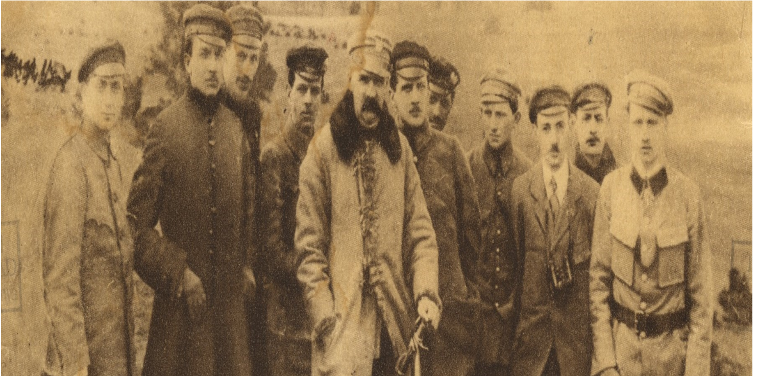
Józef Piłsudski wśród Komendy Naczelnej POW.

https://przystanekhistoria.pl/pa2/tematy/polskie-wojsko/67380,Umarl-Dziadek-siwy-a-zelazny.html