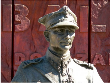
Popiersie majora Hubala w Końskich