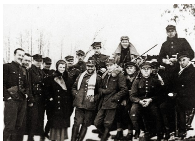
Major Hubal z żołnierzami

Przeprowadzoną przez okupanta niemieckiego akcją represyjną wymierzono bezpośrednio w ludność cywilną zamieszkałą wioski i przysiółki na terenach, na których działał Oddział Wydzielony „Hubala”. Miejscowa ludność dostarczała żołnierzom żywność oraz furaz dla koni, udzielała schronienia, a także przekazywała broń zakopaną w okolicznych lasach we wrześniu 1939 r. Należy podkreślić, że akcja represyjna objęła również swoim zasięgiem wioski, w których Oddział nie kwaterował.