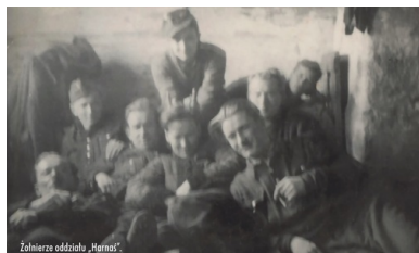
Żołnierze oddziału „Harnaś”.

„zamiarem moim jest skupić wysiłki [polskiego potencjału militarnego] do przygotowania powstania w Polsce, koordynując z nim ruchy wyzwolenicze innych ludów środkowej Europy, przede wszystkim Czechosłowacji”. 1