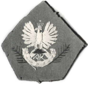
Patka płk. Franciszka Faixa.